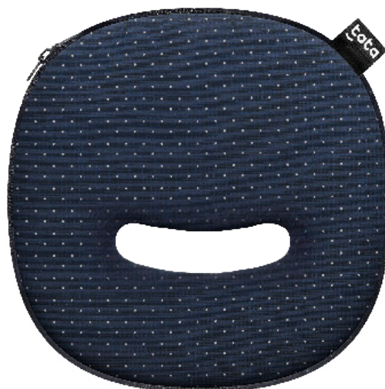
Tata Pad – Foto identificativo di prodotto