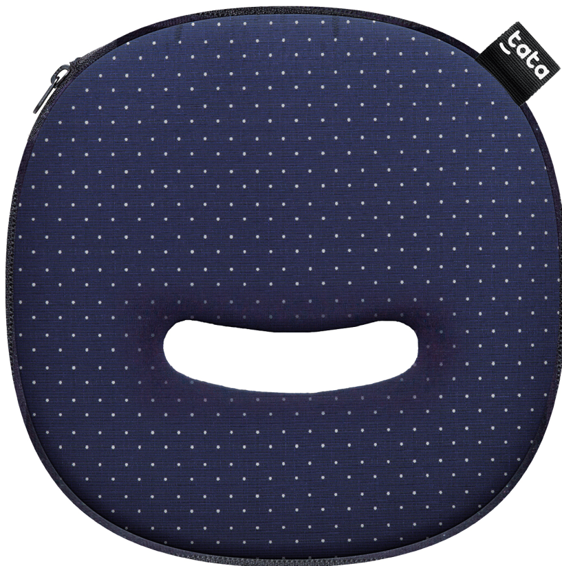
Tata Pad – Foto identificativo di prodotto